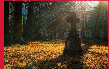
Vortrag: Wandel in der Bestattungskultur