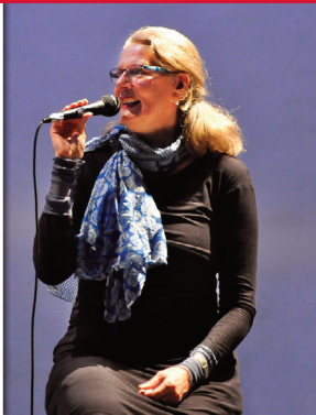
Vortragskonzert: Kaleidoskop des Trauerns

Lesung mit Hans Helmut Straub: Yasmina Reza – Eine Verzweiflung