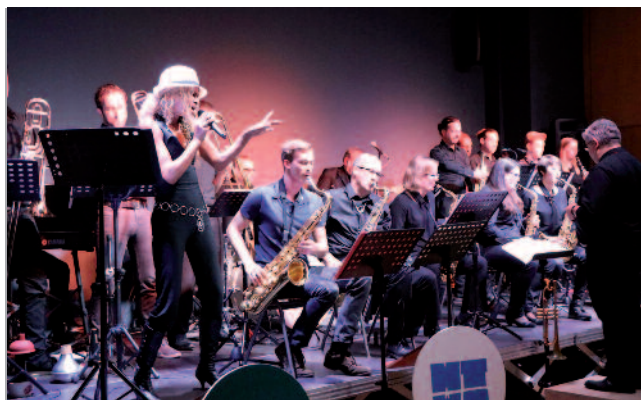
Sound Orchester Schlachthof